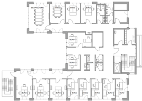
▪ Grundriss, 1. OG Ausschnitt